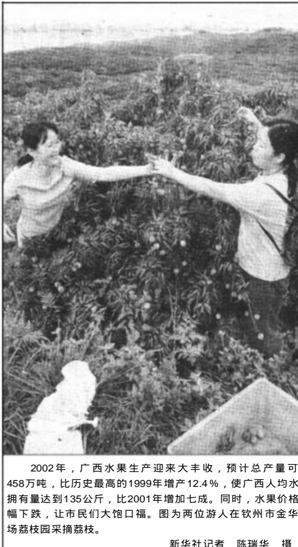
2002年，广西水果生产迎来大丰收，预计总产量可达458万吨，比历史最高的1999年增产12.4%，使广西人均水果拥有量达到135公斤，比2001年增加七成。同时，水果价格大幅下跌，让市民们大饱口福。图为两位游人在钦州市金果场荔枝园采摘荔枝。